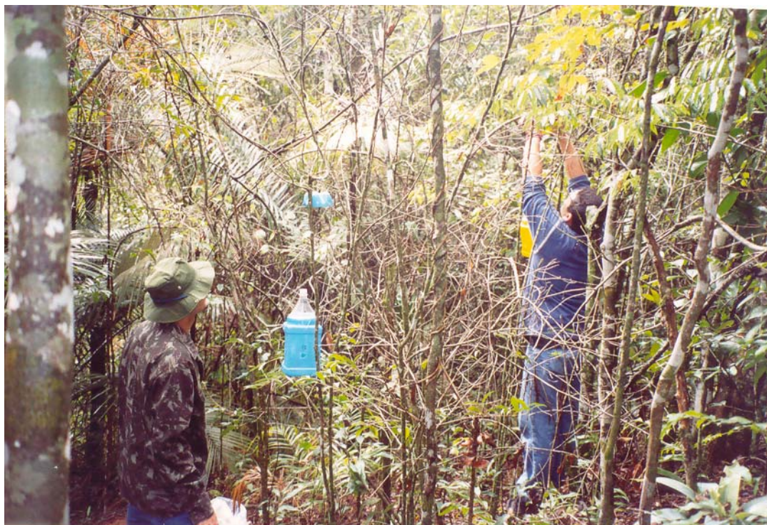
Figura 4- Primeiro ponto de coletas, evidenciando a disposição das armadilhas.