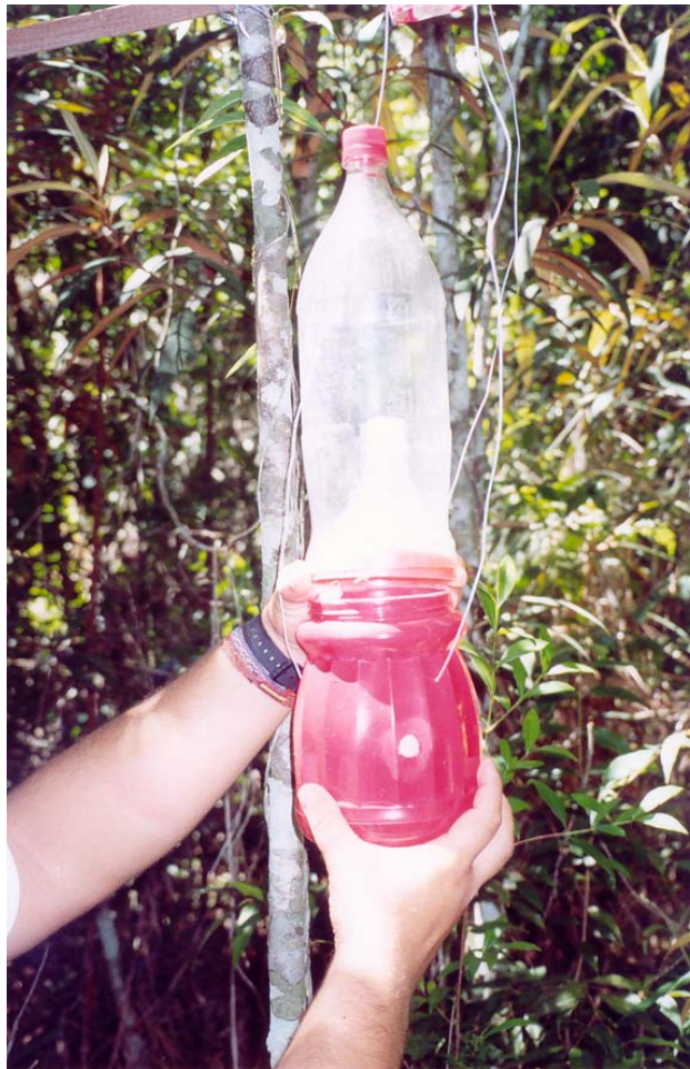
Figura 1- Armadilha, adaptada do modelo proposto por FERREIRA (1978).